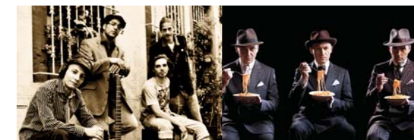
Syncopera / Gotan Project