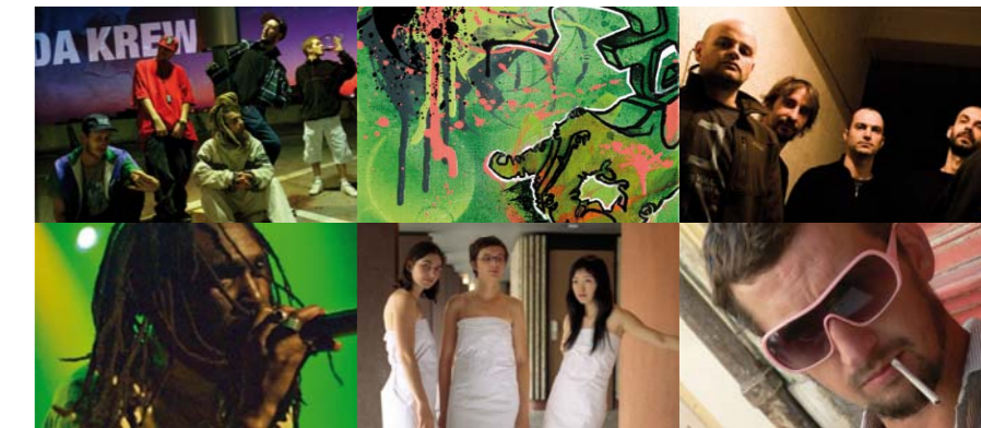
Da Krew / Exposition de la galerie éphémère des Éditeurs Libres / Kaly Live Dub / Rod Taylor / The Konki Duet / Ashley